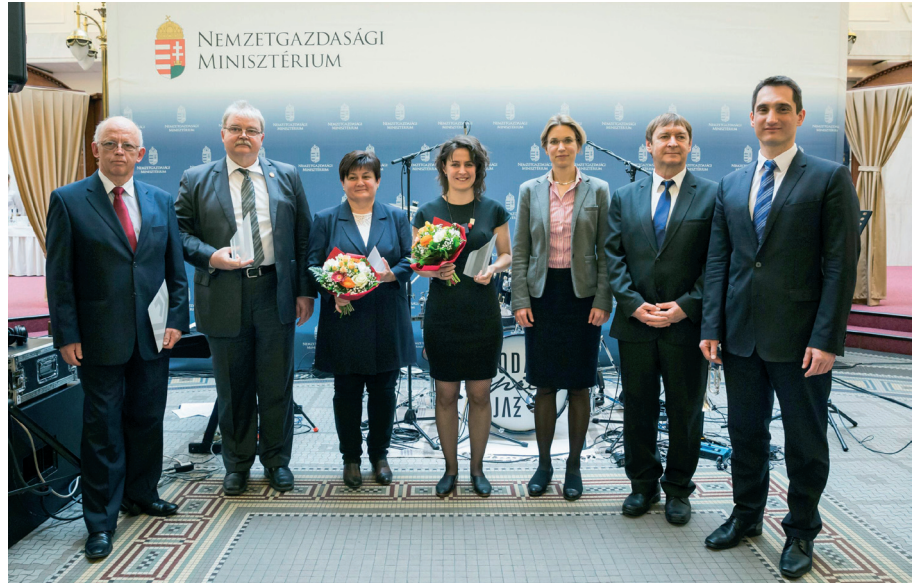
2017. évi Millenniumi Díj díjazottjai és díjátadói

Az Európában is egyedülállóan több mint 175 éve működő, állandóan megújuló, a tudástársadalom megteremtésén munkálkodó, a tehetséggondozásban, a kultúraterjesztésben megkerülhetetlen szerepet játszó Tudományos Ismeretterjesztő Társulat .