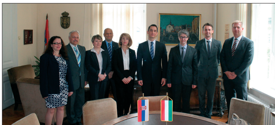
A szerb és a magyar hivatal képviselői Belgrádban

A Belgrádban lezajlott kétoldalú megbeszélések mellett aláírásra került a két hivatal közötti együttműködési megállapodás is, amely a következő területekre terjed ki: tapasztalatcsere a szellemi tulajdoni szabályozás, az ügyfeleknek nyújtott különleges IP-szolgáltatások és a szellemi tulajdonnal kapcsolatos tudatosság-növelés, valamint a szellemi tulajdonnal kapcsolatos rendezvények és oktatások szervezése terén.