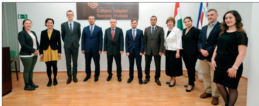
A magyar és a török delegáció az SZTNH-ban