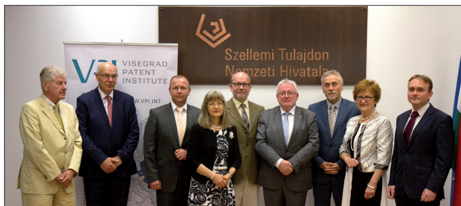
A VSZI-országok képviselői a megnyitón