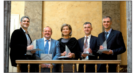
A 2016. évi Millenniumi Díjasok