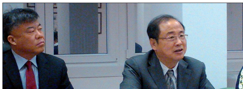
Wang Hong, a BJIPO főigazgatója és delegációja az SZTNH-ban

A találkozón a kínai fél a szellemi tulajdonvédelmi ismeretek magyarországi népszerűsítését, oktatását, illetve az innováció támogatásának tapasztalatait kívánta megismerni. Emellett az SZTNH munkatársai bepillantást kaphattak a BJIPO működésébe.