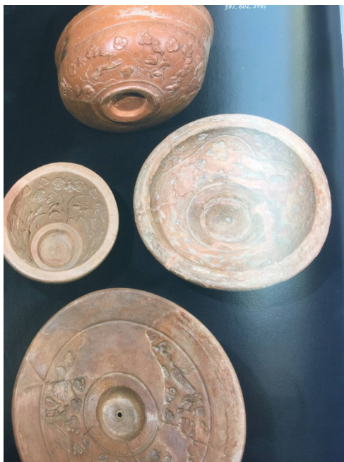
Római Pacatus-edény (terra sigillata)

iparosok, kereskedők nagy része ellátta az általa gyártott korsókat, tálakat, egyéb termékeket mesterjegyével, amely így összekötötte az előállítót (vagy annak műhelyét) az áruval. Ugyanakkor a mesterjeggyel ellátás közvetett módon a termék minőségéről is hordozott információkat a fogyasztók számára, hiszen amennyiben egy kerámián egy nevesebb, tehetségesebb, ismert mesterre utaló jegy szerepelt, a vásárlók minőségi, magas színvonalú, pontosan megmunkált árura számíthattak.