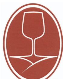
Borászok borásza díj

(511) 41 Nevelés; szakmai képzés; szórakoztatás; sport- és kulturális tevékenységek, rendezvény szervezése és díjátadás.