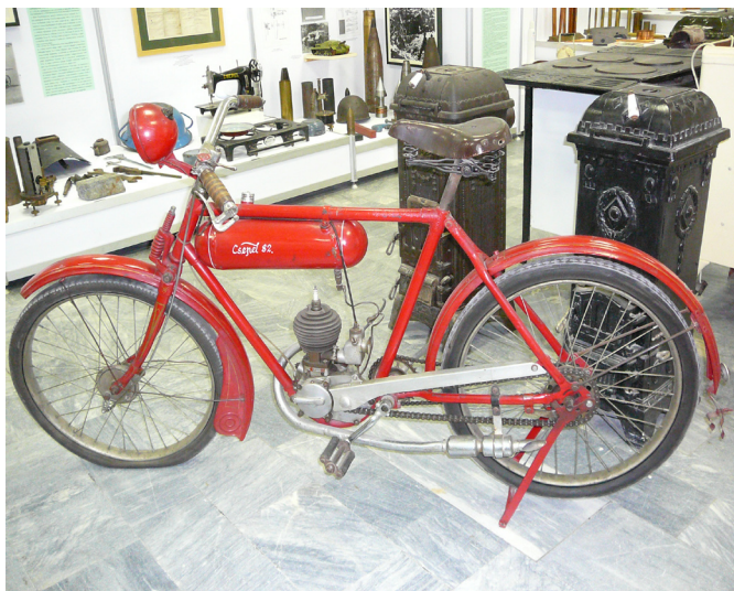
A csepeli gyár néhány terméke – a Csepeli Helytörténeti Gyűjtemény jubileumi kiállításának részlete

mányok felkutatása, a szabadalmak megvásárlása ezen a területen is szisztematikusan folyt. Példamutatóan precíz szerződés készült például a 43 092 és 45 693 lajstromszámú magyar szabadalmakkal védett permetezőkészülék kizárólagos gyártási és forgalmazási jogára vonatkozóan – kitérve az esetleges jövőbeli továbbfejlesztett változatokra is.