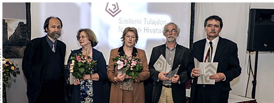
A világnapi díjazottak

A Történeti Fényképtár 1995-től a Magyar Nemzeti Múzeum önálló főosztálya. Főbb tematikus gyűjteményei: portré- és csoportkép-