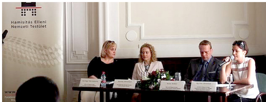
A vetélkedő eredményhirdetése az SZTNH-ban

A szerzői jogokról és a biztonságosabb internethasználatról szóló játékon az első helyet ezúttal a Szeged Városi Kollégium Fodor József Tagintézményének csapata nyerte, a második helyezett a györi Művelődési ház Overflow nevű csapata lett, a harmadik helyet a Budapesti Kommunikációs és Üzleti Főiskola Á Lá Cool nevű csapata, a negyediket pedig a barcsi Széchényi Ferenc Gimnázium és Kollégium Mad Developers csoportja kapta. Nyereimük anyagi hozzájárulás házi programjaikhoz, például osztálykirán-