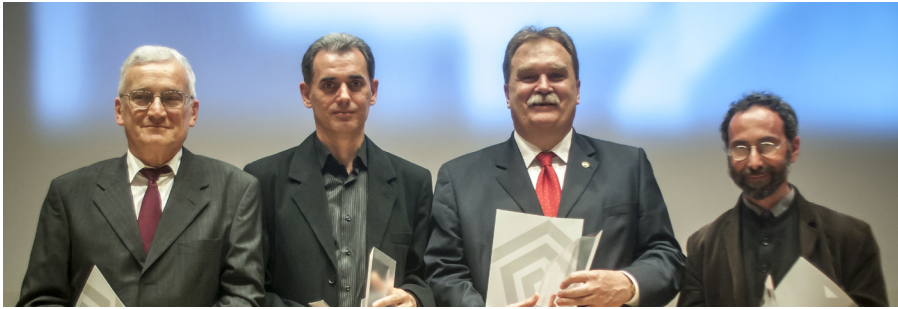
A 2013. évi Milleniumi Díj kitüntetettjei