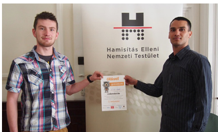
A nyertes csapat

Idén 139 csapat jelentkezett a Microsoft által indított és a Hamisítás Elleni Nemzeti Testület, a Járműipari Adatbázis Forgalmazók Szakmai Testülete, a Nokia, a Pro.Art Szövetség a Szerzői Jogokért egyesület és a Vodafone Magyarország együttműködésével szervezett vetélkedőn.