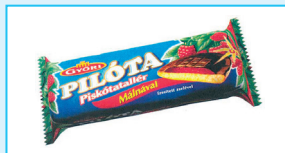
Györi Pilóta Piskótatallér (138 360 és 171 203)

Ha az új termék forgalomba hozatala során a meglévő védjegyet használják, az új termék rendelkezni fog a védjegy arculatából és hírnevéből származó előnyökkel. Az új termék tekintetében egy testreszabottabb új védjegy használata azonban előnyös lehet, és képessé teheti a vállalkozást arra, hogy az új termékekkel önálló vagy újabb fogyasztói csoportot célozzon meg (pl. tizenéveseket stb.), vagy önálló arculatot alakítson ki az új termék számára. Sok vállalkozás azt a módszert alkalmazza, hogy az új védjegyet a régivel kombinálja.