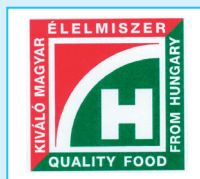
Kiváló Magyar Élelmiszer (154 794)